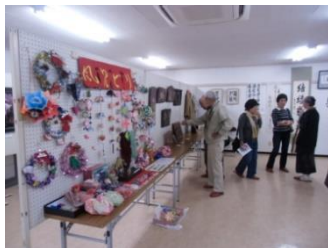
手作り作品展（屋内展示とまちかどギャラリー、隔年開催）