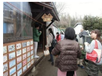
工房のリノベーション