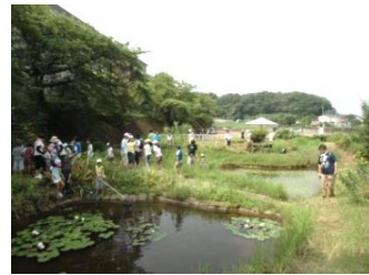
わくわく自然園（ピオトープ）