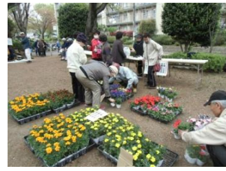
春を楽しむ集い・草花即売会