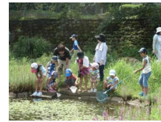
ピオトープたんけん（8月）