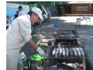
さんまパーティ（9月）