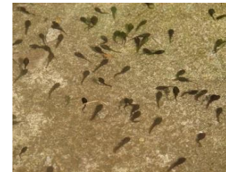
自然園のオタマジャクシ（5月）