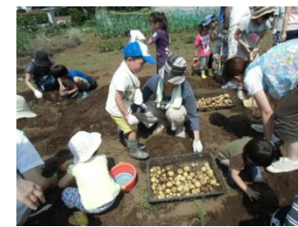
ジャガイモの収穫（6月）