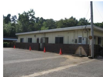
管理事務所の板塀