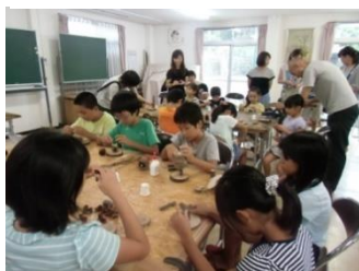
夏休み子供向け木工教室