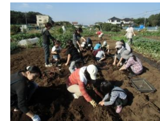
サツマイモ収穫体験（10月）