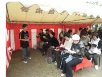
春を楽しむ集い・野だて（4月）