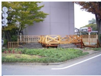
まちかど広場の木製デッキ