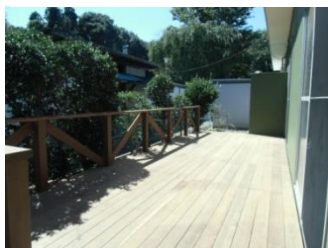
集会所の木製デッキ