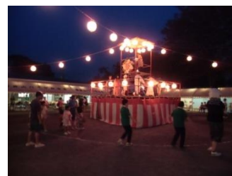
2日間にわたり開催される夏祭り（7月）