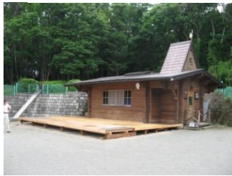
まるた小屋（あおやぎ文庫）