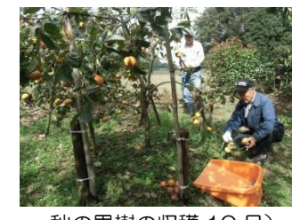
秋の果樹の収穫（10月）