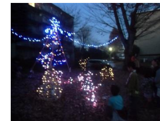
クリスマスイルミネーション（12月）