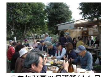
こもれび亭の収穫祭（11月）