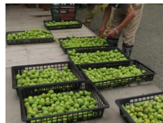
梅収穫・梅酒づくり（6月）