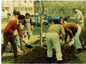
緑の倍增事業（植樹活動、5年後の事業達成記念植樹）

※緑の倍增事業では内閣総理大臣表彰や建設大臣賞などを受賞、まるた小屋事業ではふるさとづくり地方審査賞、わくわく自然園事業ではさいたま環境賞を受賞。