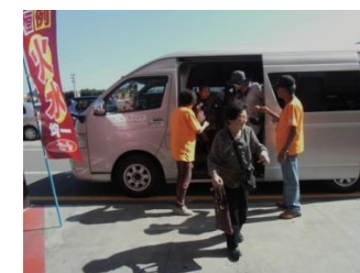
買物支援サービス