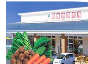
あぐれっしゅげんき村