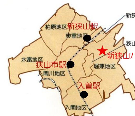
新狭山地区 柏原地区 新狭山駅 奥富地区 狭山台地区 水富地区 狭山市駅 入間川地区 入間地区 入曽駅 新狭山ハイツ