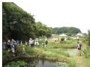
わくわく自然園④(調整池)