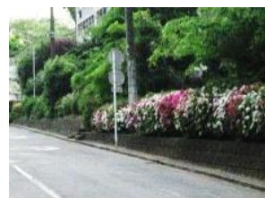
オオムラサキツツジ(5月)