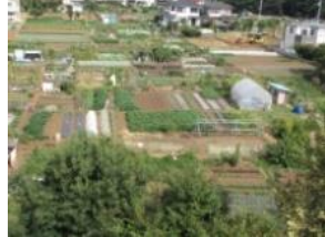
楽農クラブ⑧(ハイツ隣接地)