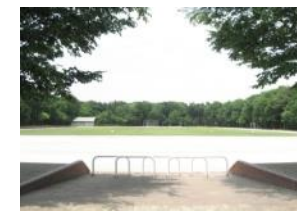
堀兼・上赤坂公園