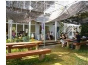
狭山ベリーランド