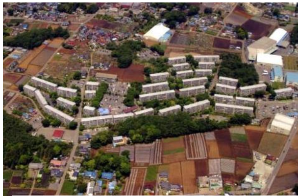
空から見たハイツ(南側からの俯瞰)